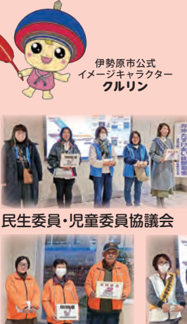
民生委員・児童委員協議会