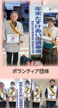
ボランティア団体