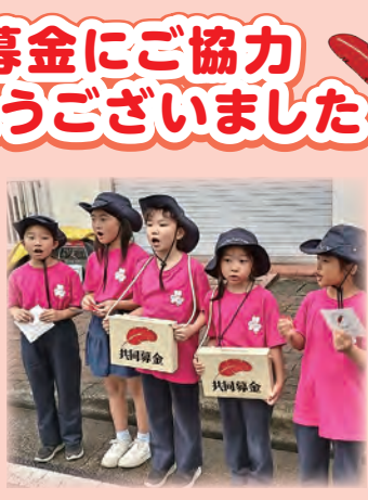
ガールスカウト神奈川県第33団