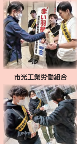
市光工業労働組合