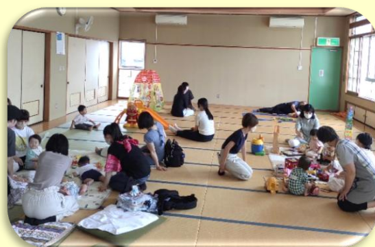
子育てサロンの様子