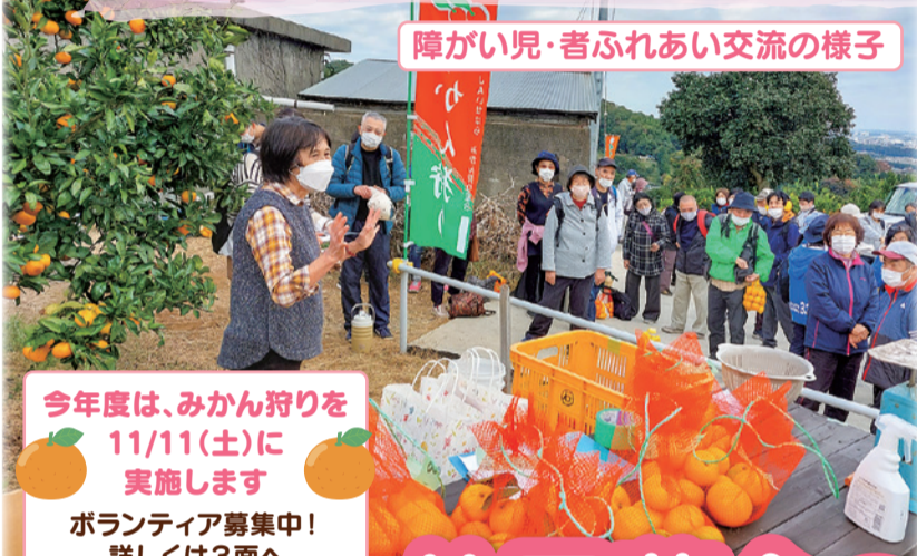
障がい児・者ふれあい交流の様子

今年度は、みかん狩りを 11/11(土)に 実施します ボランティア募集中! 詳しくは3面へ