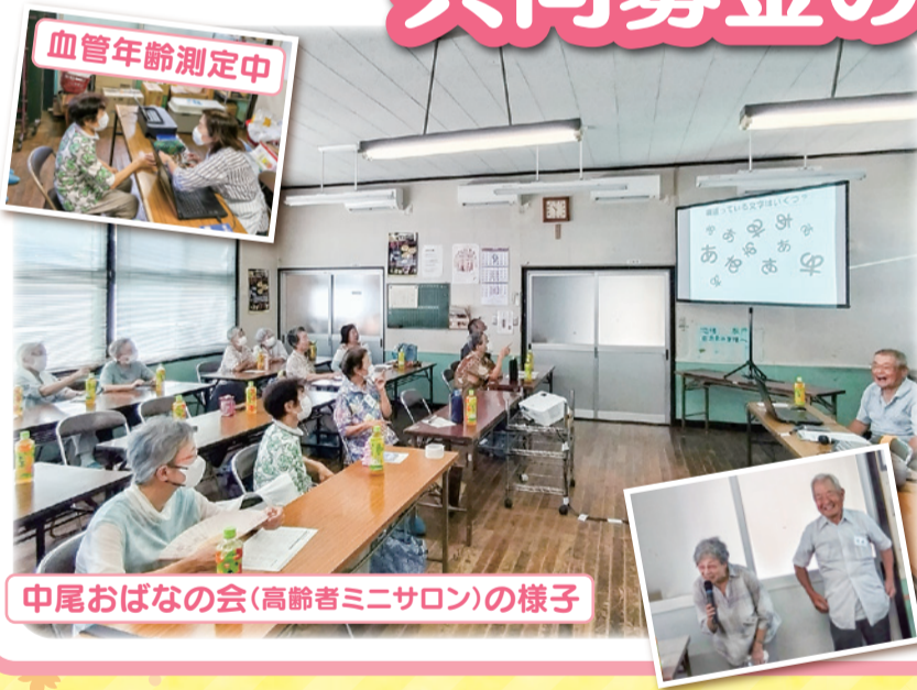
中尾おばなの会(高齢者ミニサロン)の様子