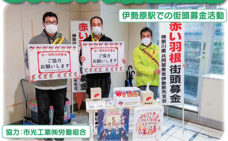
協力:市光工業(株)労働組合