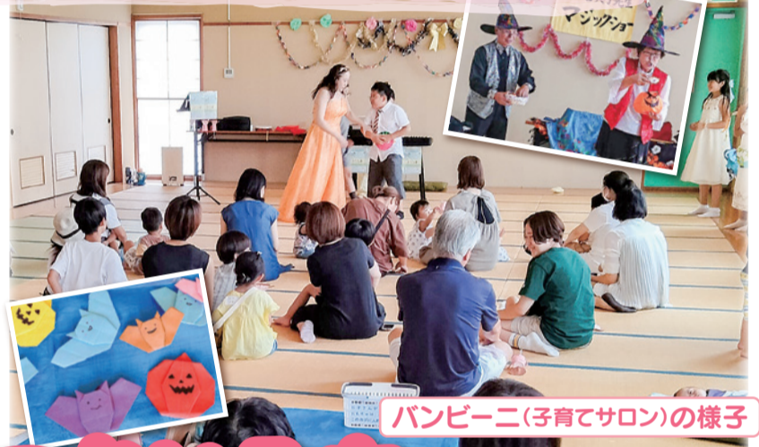
バンビーニ(子育てサロン)の様子

今年度は、みかん狩りを 11/11(土)に 実施します ボランティア募集中! 詳しくは3面へ