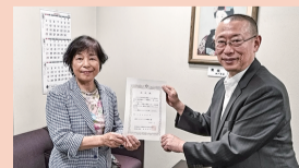
国際ソロプチミスト伊勢原

令和5年度実績(累計) ●寄託金 12件 125,530円 ●寄託品 6件(お菓子、米、衣類、食品等)