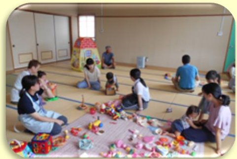
子育てサロンの様子

*成瀬地区民生委員児童委員協議会の方々及び地域住民の方にボランティアとしてご協力いただいています。