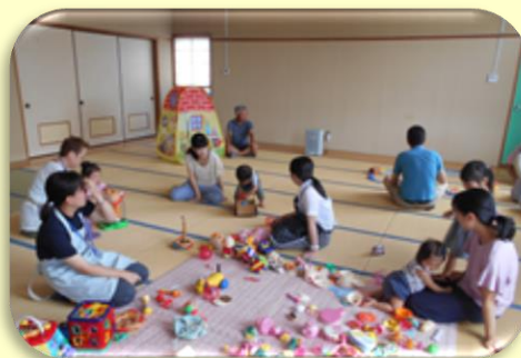
子育てサロンの様子

*成瀬地区民生委員児童委員協議会の方々及び地域住民の方にボランティアとしてご協力いただいています。