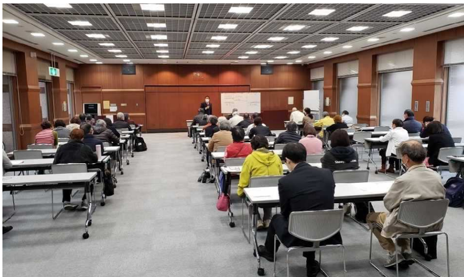
（11月27日に開催した成年後見制度市民向け普及啓発講演会）