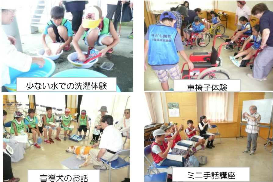
少ない水での洗濯体験