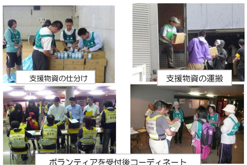
ボランティアを受付後コーディネート