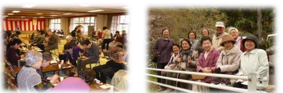
協力：思親会・民生委員児童委員協議会高齢者福祉部会