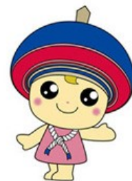
伊勢原市公式イメージキャラクター クルリン