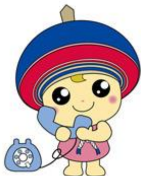
伊勢原市公式イメージキャラクター クルリン

職員がご自宅に訪問し、お困りの内容等をお伺いし、どのような協力ができるかご提案します。