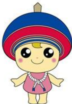
伊勢原市公式イメージキャラクター クルリン

やすらぎサービスは、高齢や障害、傷病、産前産後などで、日常生活でお困りの方の負担を少しでも軽くするため、市民の参加と協力により低額の料金で調理・掃除等の家事援助サービスや通院や外出などの介助サービスを提供しています。