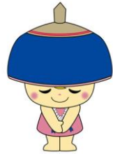
伊勢原市公式イメージキャラクター クルリン

●利用会員の意向を伺い、協力会員の調整を行います。すぐに見つからない場合もありますこと、ご了承ください。